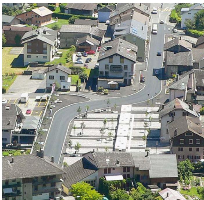
et après la réalisation