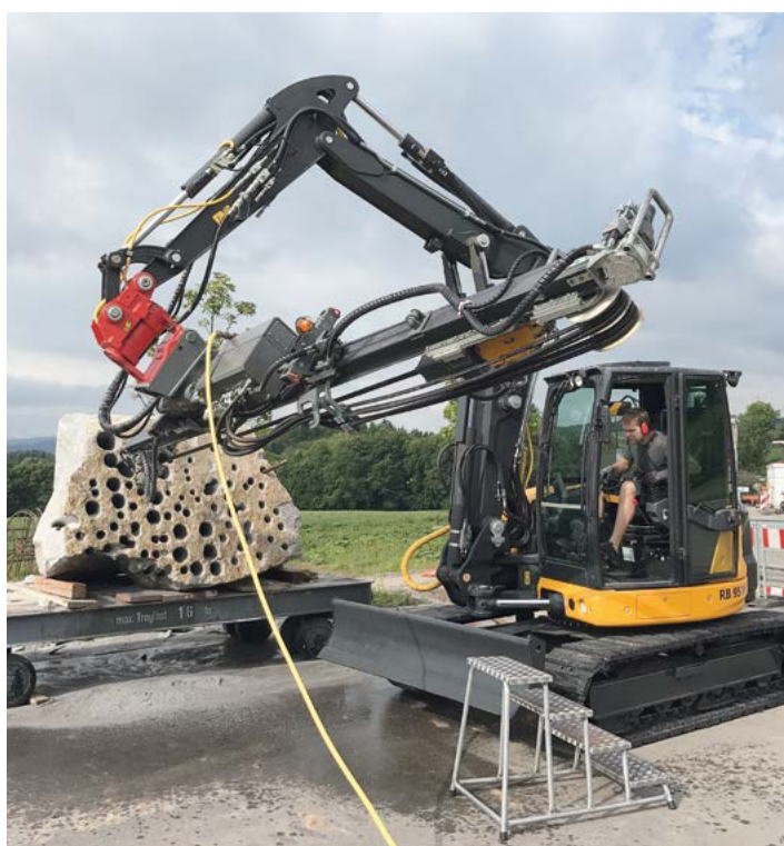
Notre nouveau utensile de forage de Morath