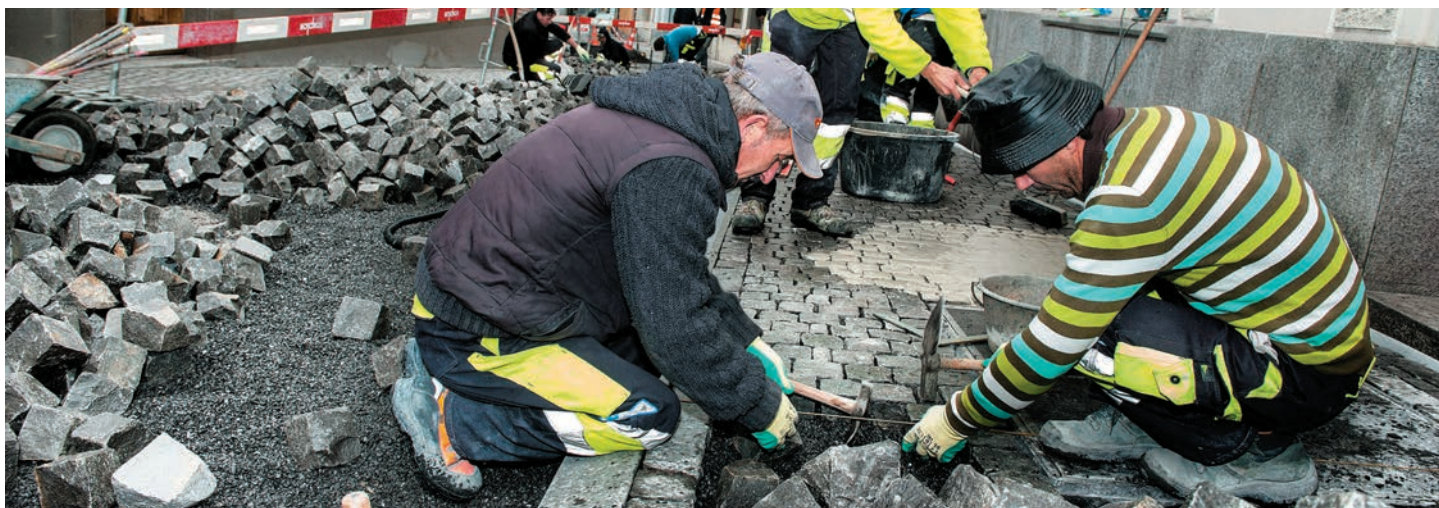
Chantier en pleine effervescence à la Zeughausgasse ..

Le caractère historique de la vieille ville a été mis en exergue par la revalorisation de la Zeughausgasse. En dépit des coûts supplémentaires par rapport au revêtement bitumineux, le travail consistant à rénover toute la Zeughausgasse avec des pierres GUBER en a vraiment valu la peine. Le traitement spécial des pierres a permis d'aménager cette ruelle en l'adaptant aux handicapés. Un peu plus de 100'000 pierres ont été posées. Une fois le travail achevé, les réactions positives de la population ne se sont pas fait attendre.