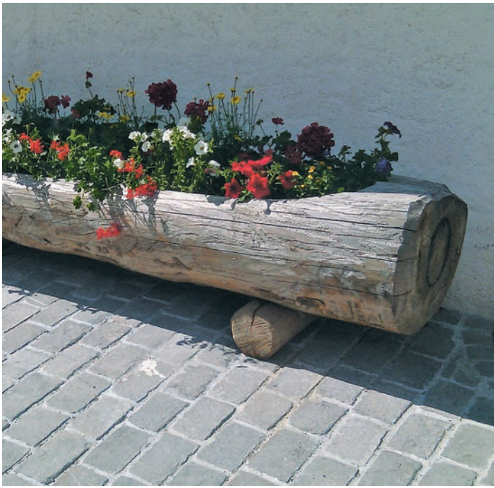
Les fleurs mettent-elles en valeur la pierre Guber ou est-ce le contraire...?