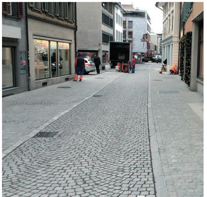
Pavages en rangées liés sur les trottoirs, boutisses type 12 et 15 biseautées et flammées avec une hauteur de 28 à 34 cm