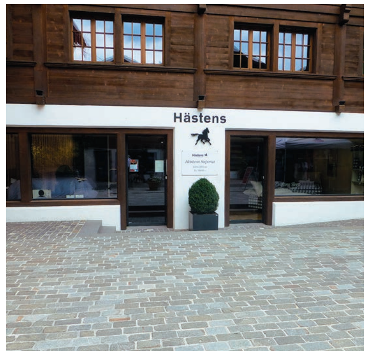
Boutisses 12 avec surface adaptée aux handicapés