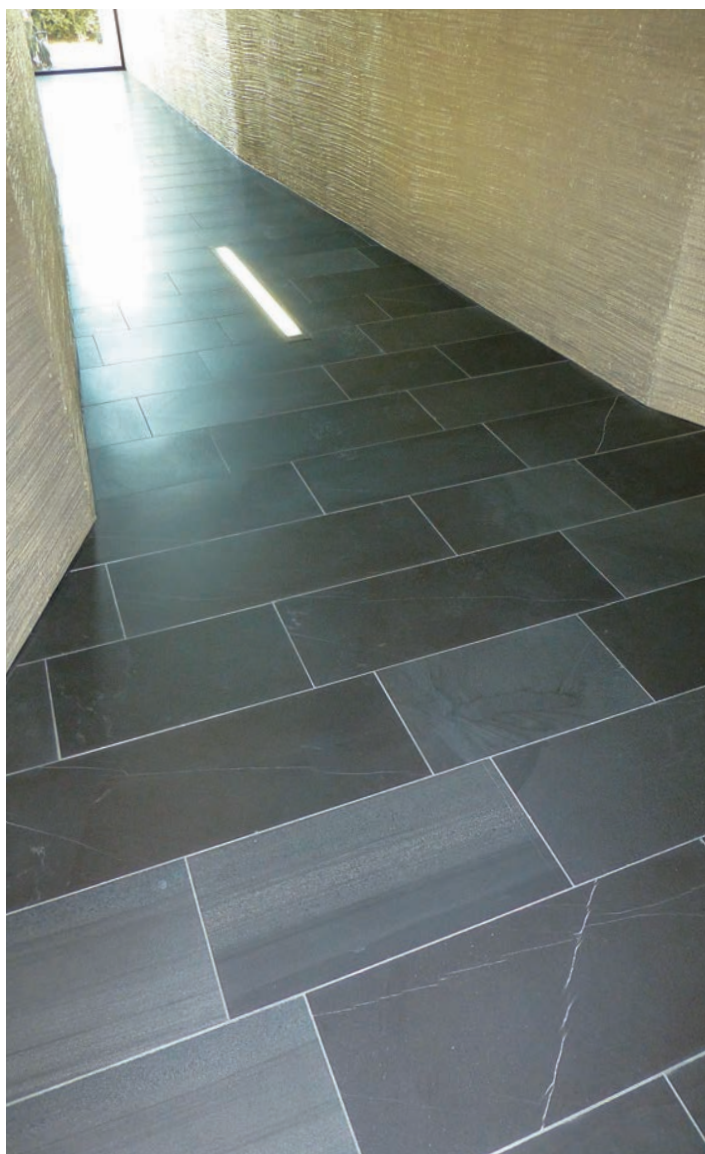
Dalles de revêtement pour sols poncées C220, format: 40 / longueurs libres / 1,5 d'épaisseur

pour le secteur extérieur. Les plaques pour revêtement de faible épaisseur et les pierres de mur massives ne sont que deux exemples parmi la multitude de nos produits clivés. Les pavés et les boutisses clivés font partie de ce vaste assortiment au même titre que les pavés - poncés et flammés - avec surfaces adaptées aux personnes handicapées. Il s'agit ici d'un petit échantillon de l'utilisation de nos produits. Vous pourrez vous en faire une idée dans les grandes lignes dans le nouveau numéro de l'«Âge de la pierre». D'ores et déjà, nous vous en souhaitons une agréable lecture.