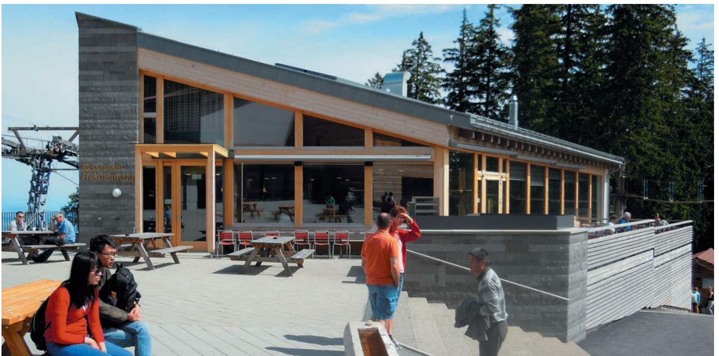
Plaques pour revêtement clivées, joints d'assise et d'about fraisés au diamant: format 10,15 et 20 longueurs libres / 3 cm d'épaisseur