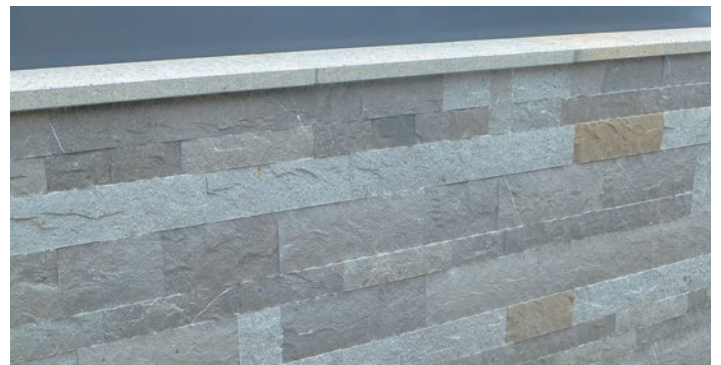
Plaques pour revêtement avec couvertines de mur flammées