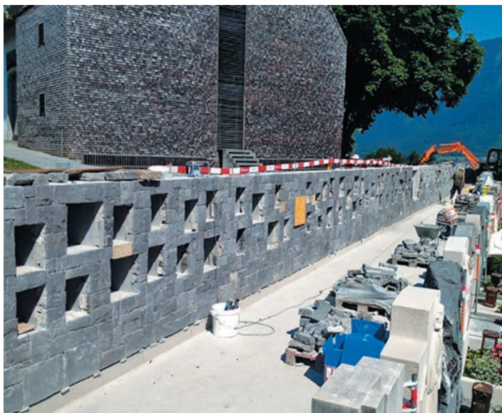
Maçonnerie écossaise avec niches d'urne

Les travaux ont donné naissance à un lieu fonctionnel, dégageant une atmosphère toute spéciale, ce qui souligne les qualités existantes. La paroi d'urnes - conçue d'après le modèle d'une paroi photographique - confère un caractère sortant de l'ordinaire sans toutefois laisser de côté le respect que l'on doit à un tel lieu. Les murs en pierres naturelles encadrent ce haut lieu historique en marquant son importance pour l'environnement et la population.