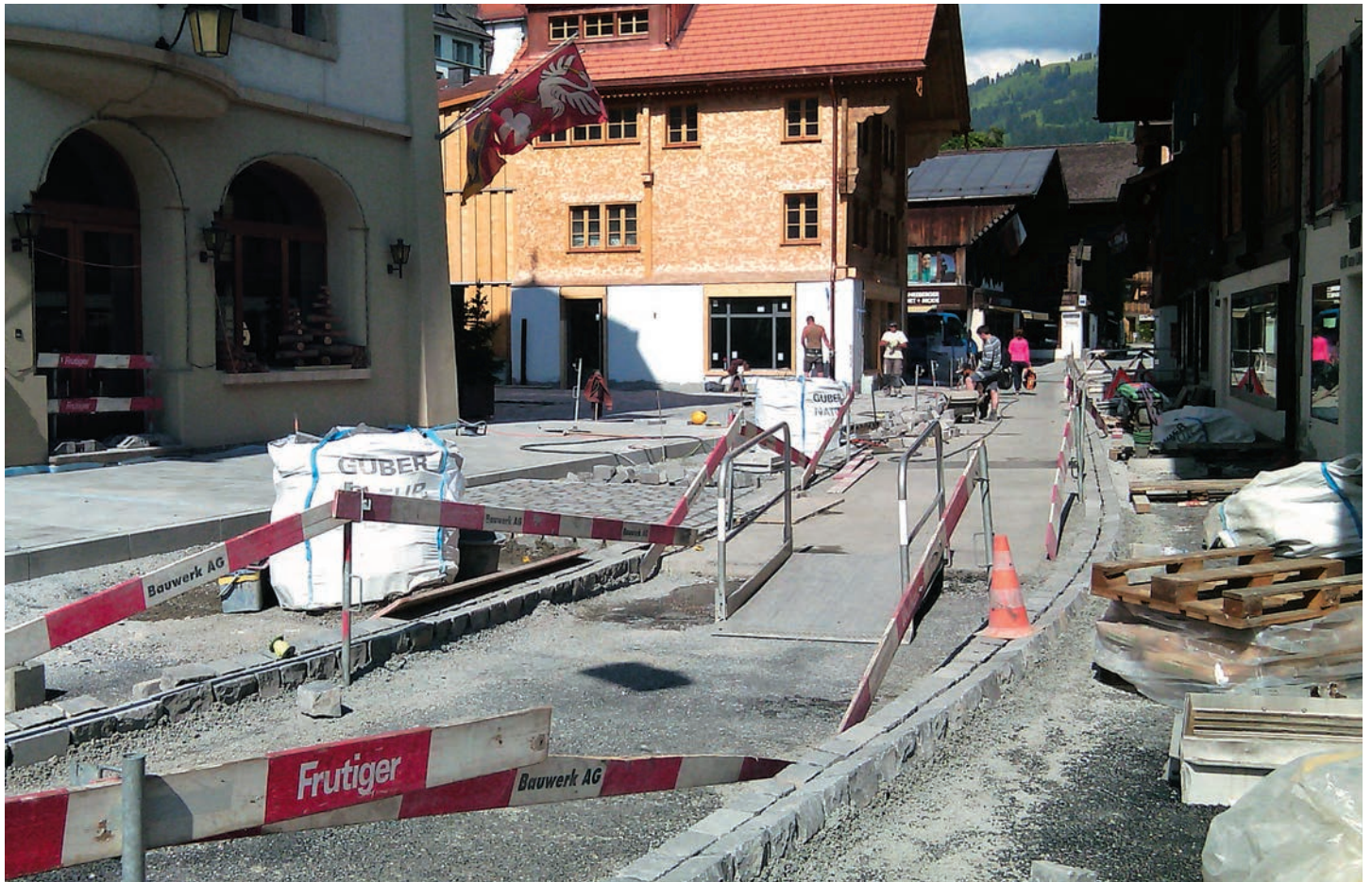
Les travaux battent leur plein...

fleurs et bornes d'incendie à l'ancienne ont été intégrés dans cette zone. Les bancs confortables et les superbes façades de maison autour de la place contribuent aussi à l'embellir. Pendant les travaux de mars 2014 à août 2 Saanen, Guber Natursteine AG a livré environ 900 tonnes de boutisses et 300 m 2 de dalles de revêtement pour sols.