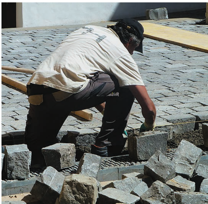
Un coup d'œil sur les paveurs au travail...