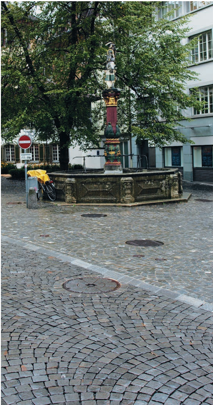
Pavage en arc non lié avec des pavés 8/11 flammés (adapté aux personnes handicapées)