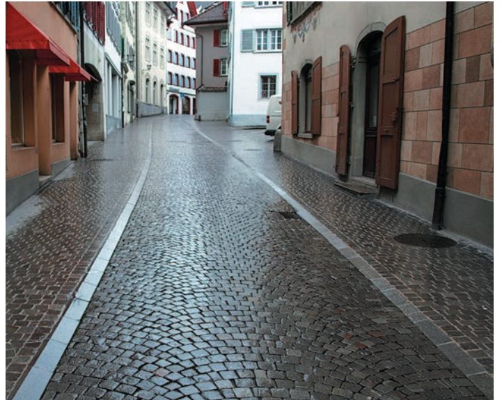
Lorsque la chaussée est mouillée, les couleurs des pavés sont plus intenses