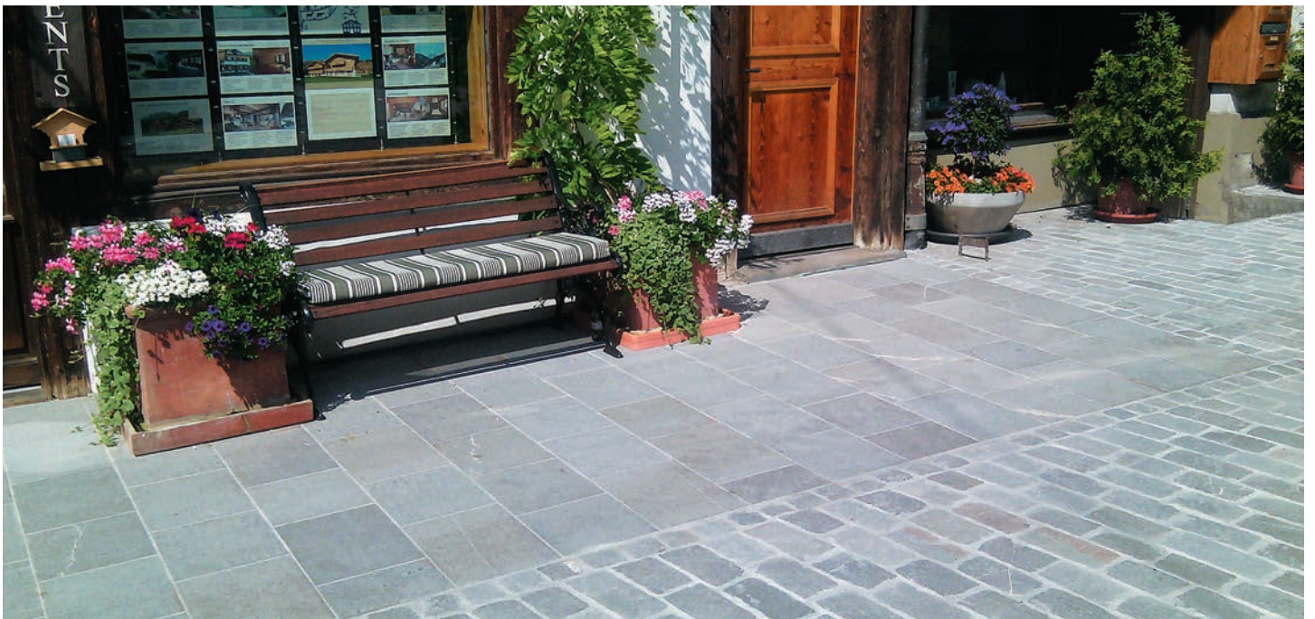
Un détail de la place: dalles de revêtement pour sols flammées avec à côté des pavages avec boutisses 12 flammées