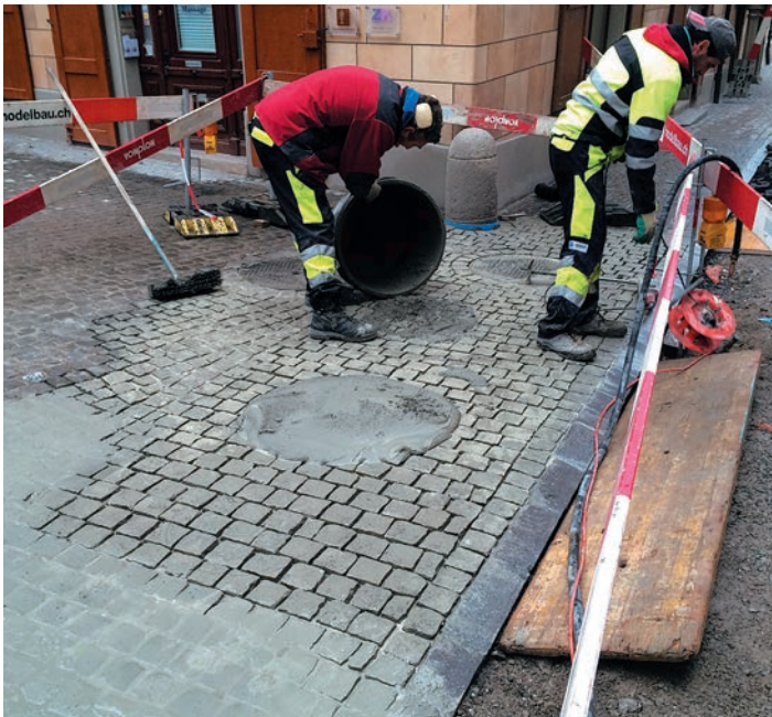
Les paveurs lors du jointoiement des pavés GUBER