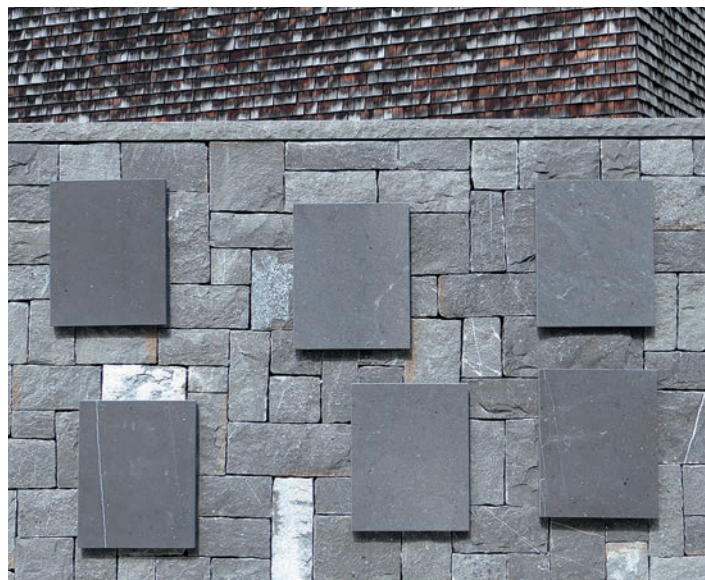
Dalles de revêtement pour murs poncées pour parachever les niches d'urne