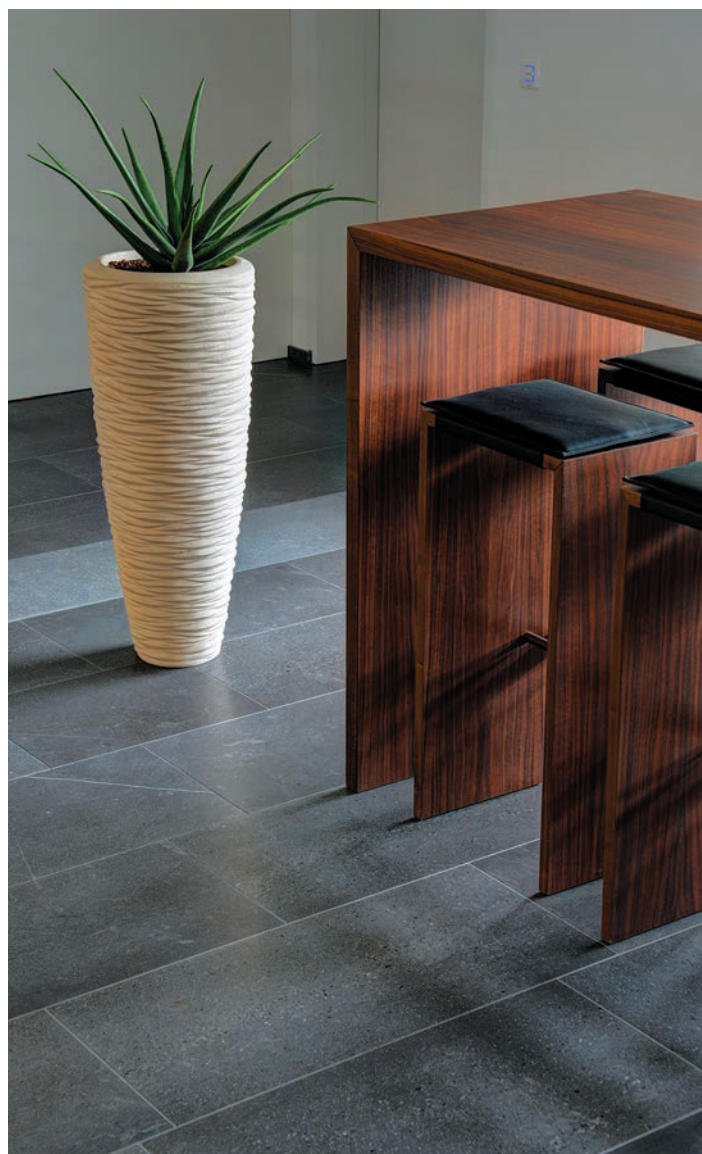
Dalles de revêtement pour sols poncées C220, format: 40 / longueurs libres / 1,5 d'épaisseur