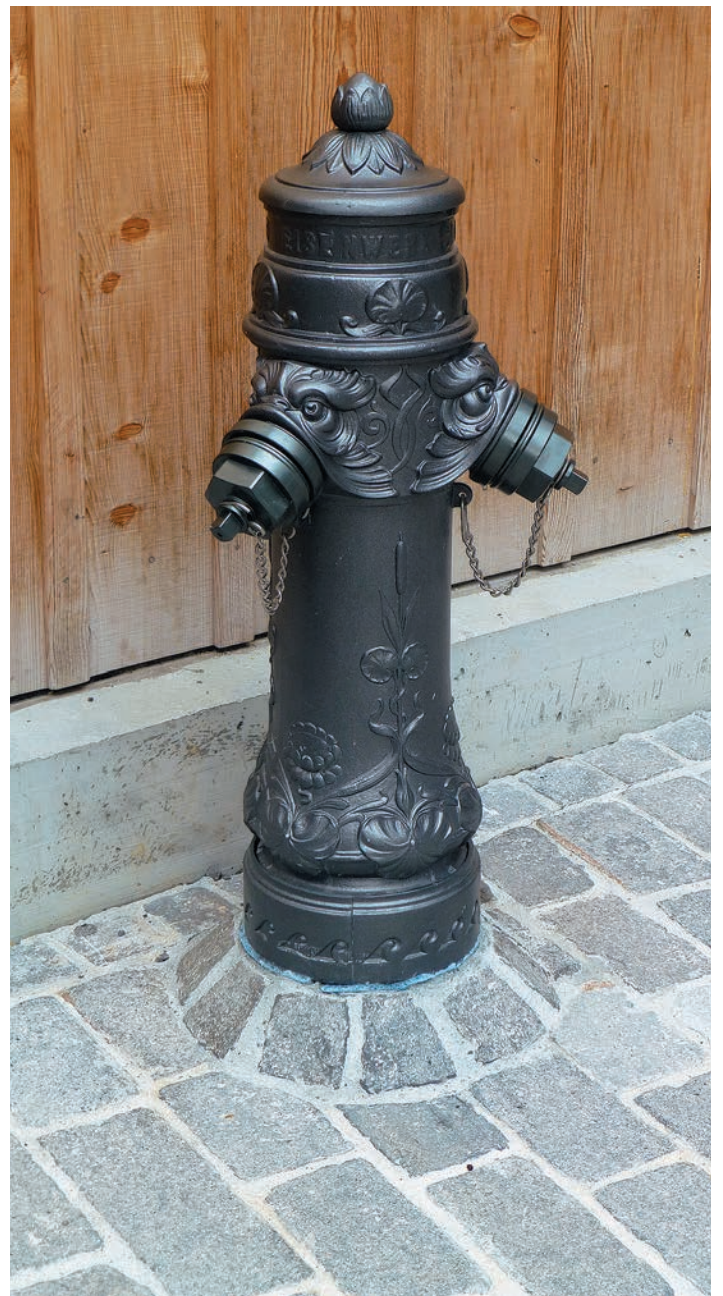
Joli détail de raccordement de borne d'incendie à l'ancienne