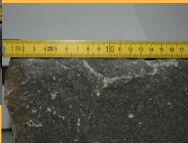
... et après le traitement