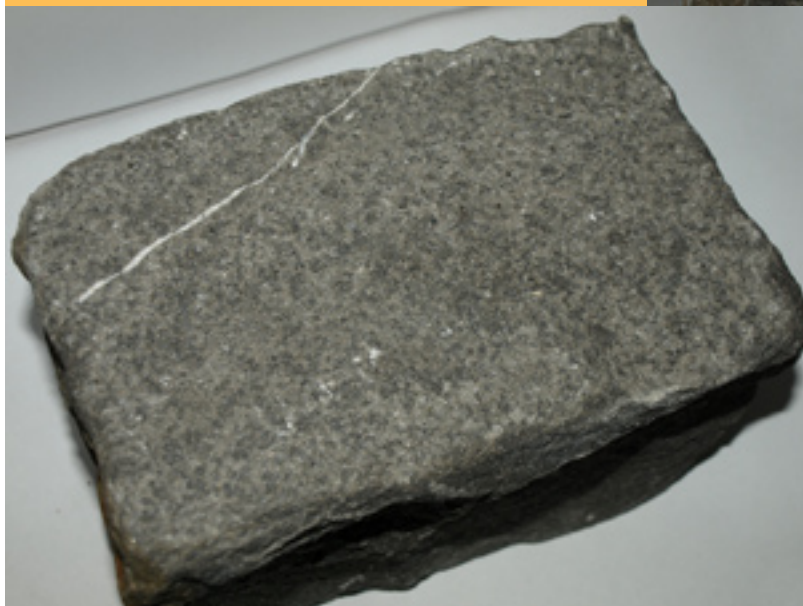
Le produit fini