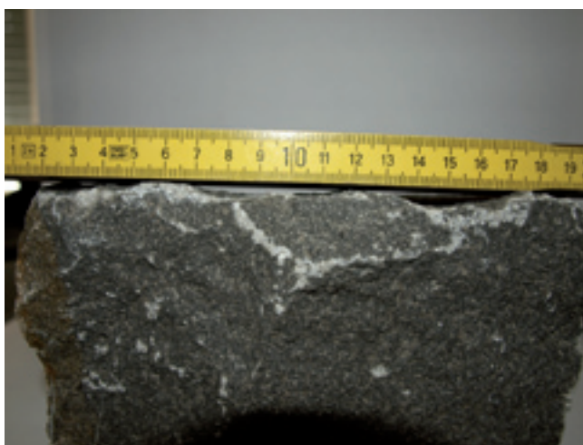
Le pavé avant ...