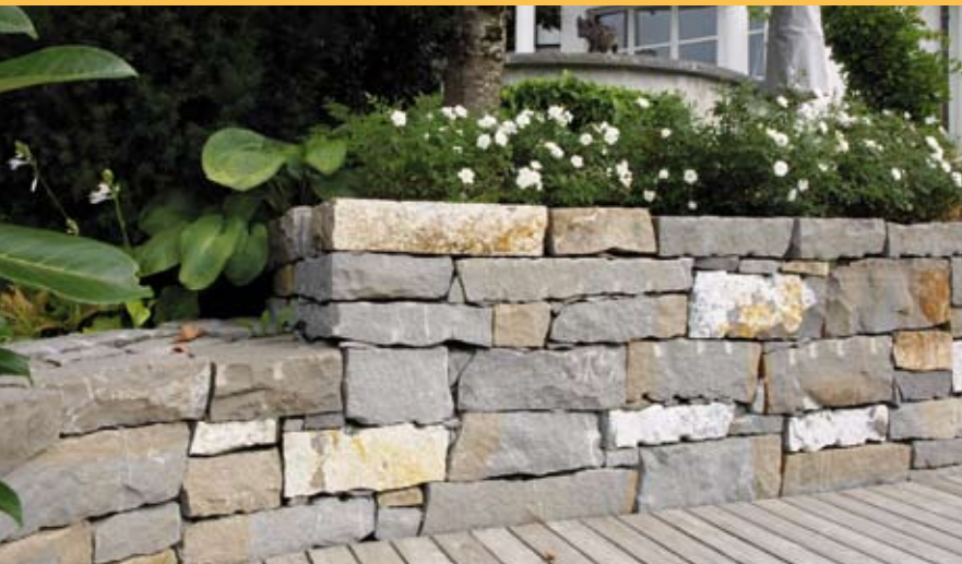
...Mur en pierre sèche...