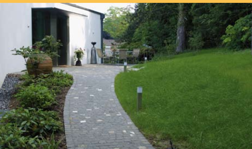
...Pavage avec pavés de tête blanche...