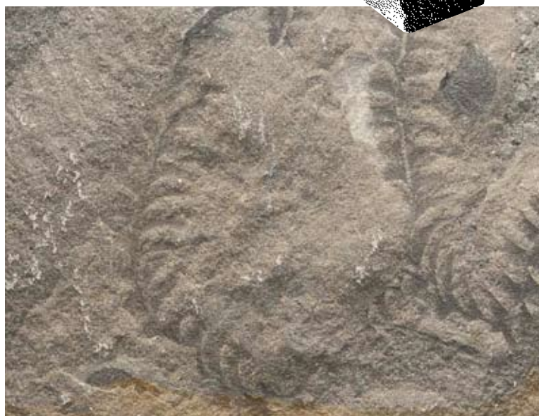
Fossilisations de la carrière au-dessus d'Alpnach