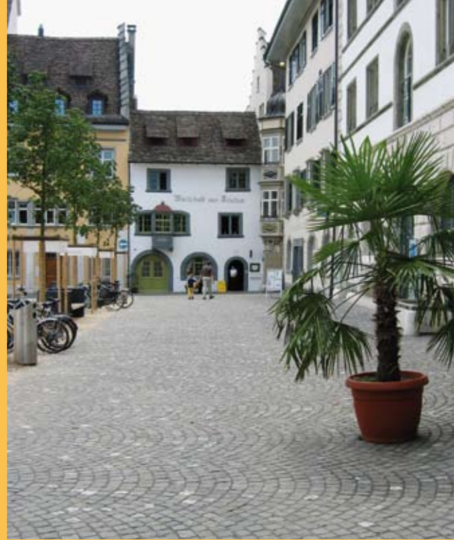
...Pavage en arc...