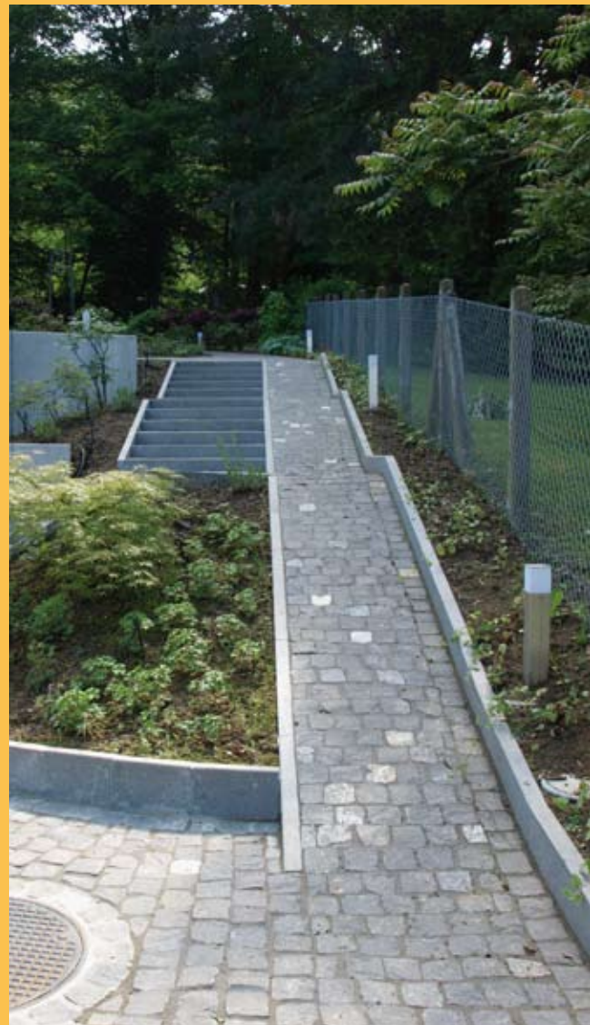
...Bordurettes, marches d'escalier, pavage en rangées.