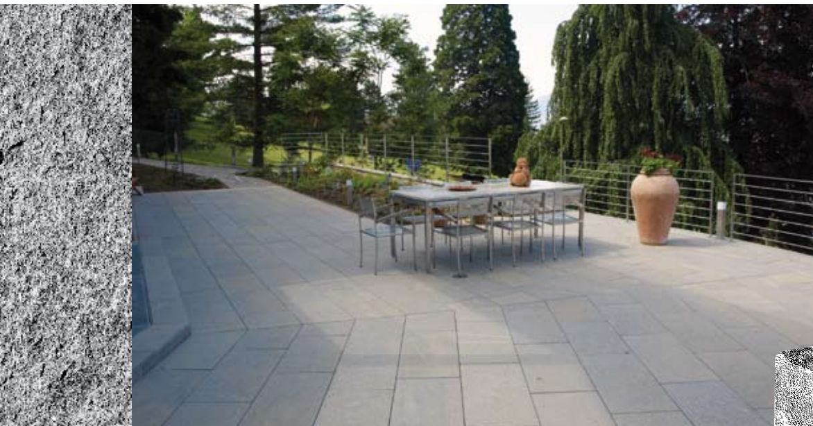
Dalles de revêtement pour sols flammées...

«dans ce contexte, les pierres naturelles sont en vogue et sont fortement prisées pour l'aménagement de jardins et de paysages. La transformation de ce matériau avec tout le professionnalisme requis permet à la branche verte de se profiler.» La clientèle de haut