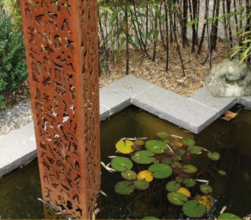
...Dalles de recouvrement flammées...